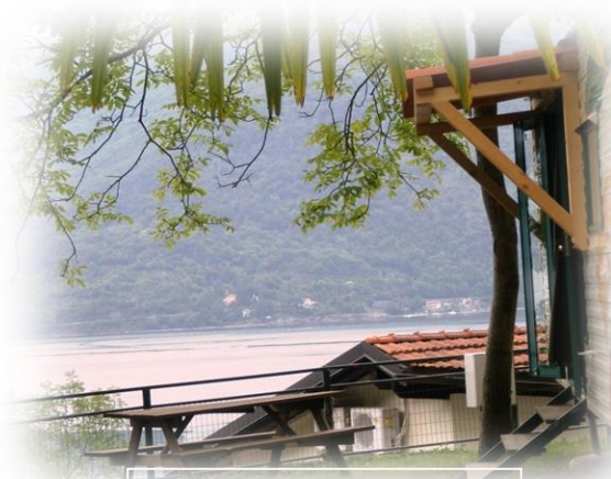
Bungalow Mobile Home