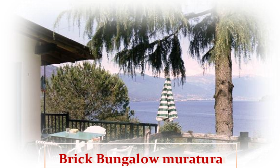
Brick Bungalow muratura

... Because it meets the needs of all types of Guests: for those who love to relax or those who enjoy a sporting holiday with diving school, swimming, sailing, windsurfing or kitesurfing. It's also a ideal starting point to navigate the Lake Maggiore even with Public Ferryboats and motor boats; to organize trips and excursions in Val Cannobina, to practice cycling and to enjoy mountain biking.